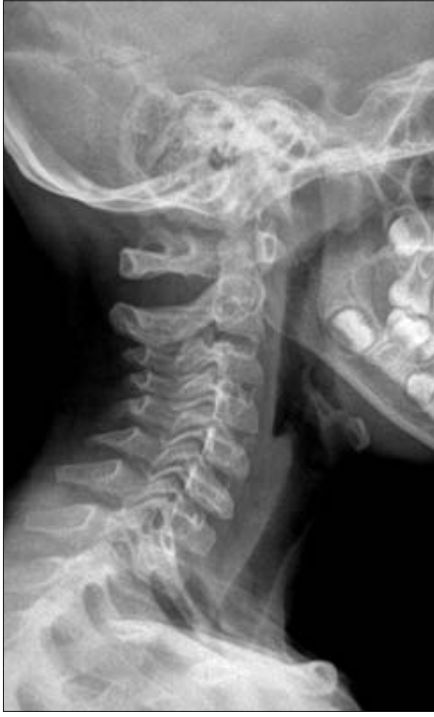
Şekil 4. Altı ay sonra alınan kontrol lateral servikal grafide C6-7 intervertebral disk seviyesinde kalsifikasyon izlenmiyor.

kontur düzensizlikleri, skleroz, tortikollis varsa görülebilir (6,8). Kalsifikasyonun görülmesi ilk birkaç ay içinde olurken, hastaların %95'inde en fazla 6 ay sonra rezolüsyon göstermiştir. Çoklu seviyede lezyon var-